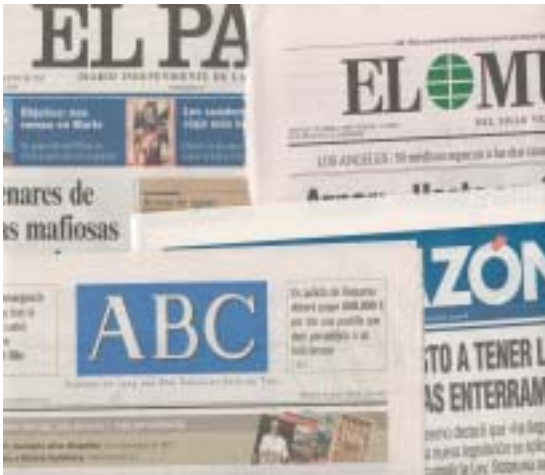
La comunicación es un mundo siempre apasionante

Durante el mes de septiembre estará abierto el plazo de inscripción para este Taller que dará comienzo en el mes de octubre. La inscripción y asistencia son totalmente gratuitos .