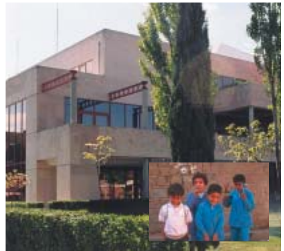
Conocer el idioma, un paso a la integración

Las clases se desarrollarán en la Concejalía de Servicios Sociales y Mujer, C/ Cdad. de La Rioja, 2. El curso es totalmente gratuito .