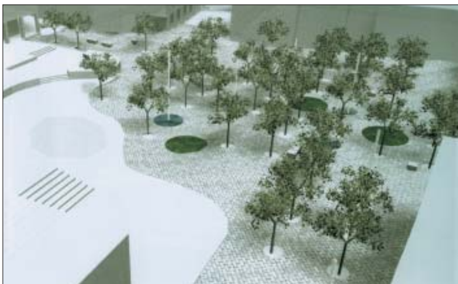
En la imagen, simulación de la Plaza de España tras la remodelación

El proyecto de la Plaza de España es recuperar para el centro urbano una amplia zona verde , con un conjunto de fuentes mezcladas con diversas especies de árboles produciendo un ambiente que invite al paseo y al descanso. Se mantendrá el Templete de la Plaza y la ampliación será a base de granito artificial dando la sensación de patio interior.