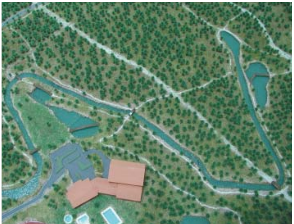
Imagen de la maqueta del Canal a su paso por Navalcarbón

Este Canal tendrá como objetivos fundamentales, además de recuperar parte de la historia de nuestro municipio, un objetivo medio ambiental, ya que se recuperará la flora y fauna de ribera y un objetivo de carácter deportivo y de ocio, ya que permitirá el piraguismo, así como su disfrute como paseante . Tendrá una extensión de 1.200 metros, y contará con lagunas artificiales.