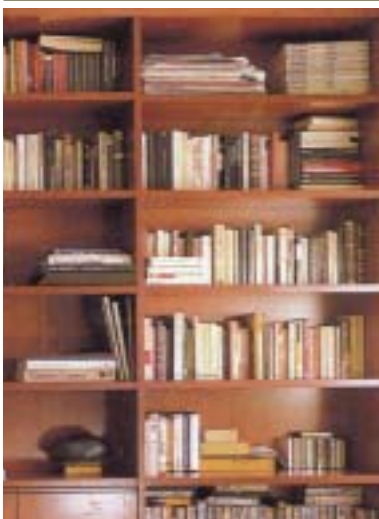
Rompiendo las barreras del estudio

Un año más, la Concejalía Servicios Sociales y Mujer pondrá a disposición de los vecinos de Las Rozas el servicio de apoyo socio-educativo para este curso escolar que comienza.