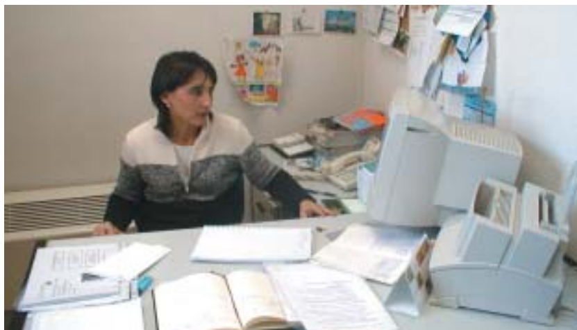
En la Concejalía encontrarás gente joven como tú.