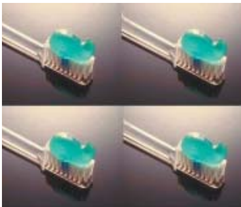
La Salud Buco-Dental es uno de los objetivos del programa

El programa de Salud Escolar está dirigido a Centros Escolares Públicos, Privados y Concertados que deseen adscribirse a este programa, que contiene las siguientes medidas: