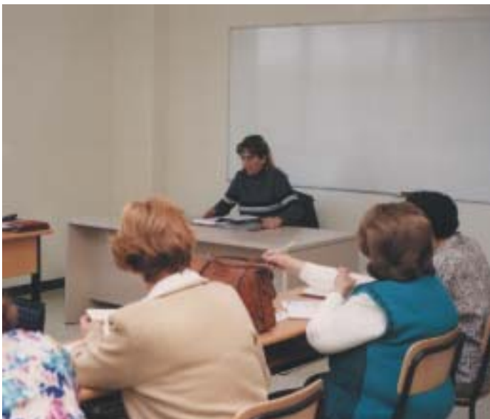
Educación de Adultos ofrece un interesante abanico de materias

En el mes de septiembre se abre el plazo para la matriculación en Educación de Adultos. El curso dará comienzo en octubre, en horario de mañana y tarde, con una interesante agenda de materias: