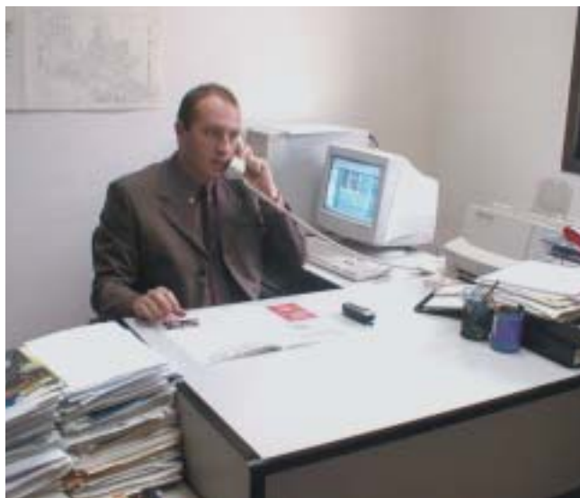
Asesorarse siempre es el mejor comienzo

4. Servicio de acceso gratuito a INTERNET.