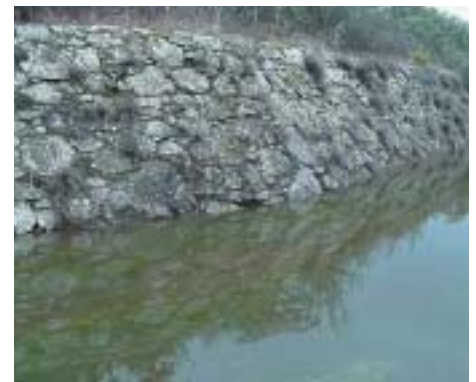
En las imágenes, partes del Canal en su estado actual a su paso por la Dehesa