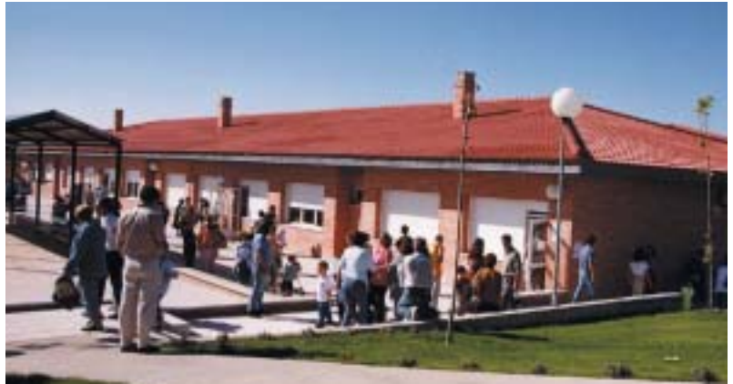
El final del verano siempre da paso al gasto de adquisición de libros de texto

Las peticiones deben realizarse en cada Centro Docente. Con el objetivo de ayudar a las familias a hacer frente a este gasto que inevitablemente se realiza a comienzos del curso escolar, el Ayuntamiento roceño ha habilitado una partida presupuestaria de 6.010 euros .